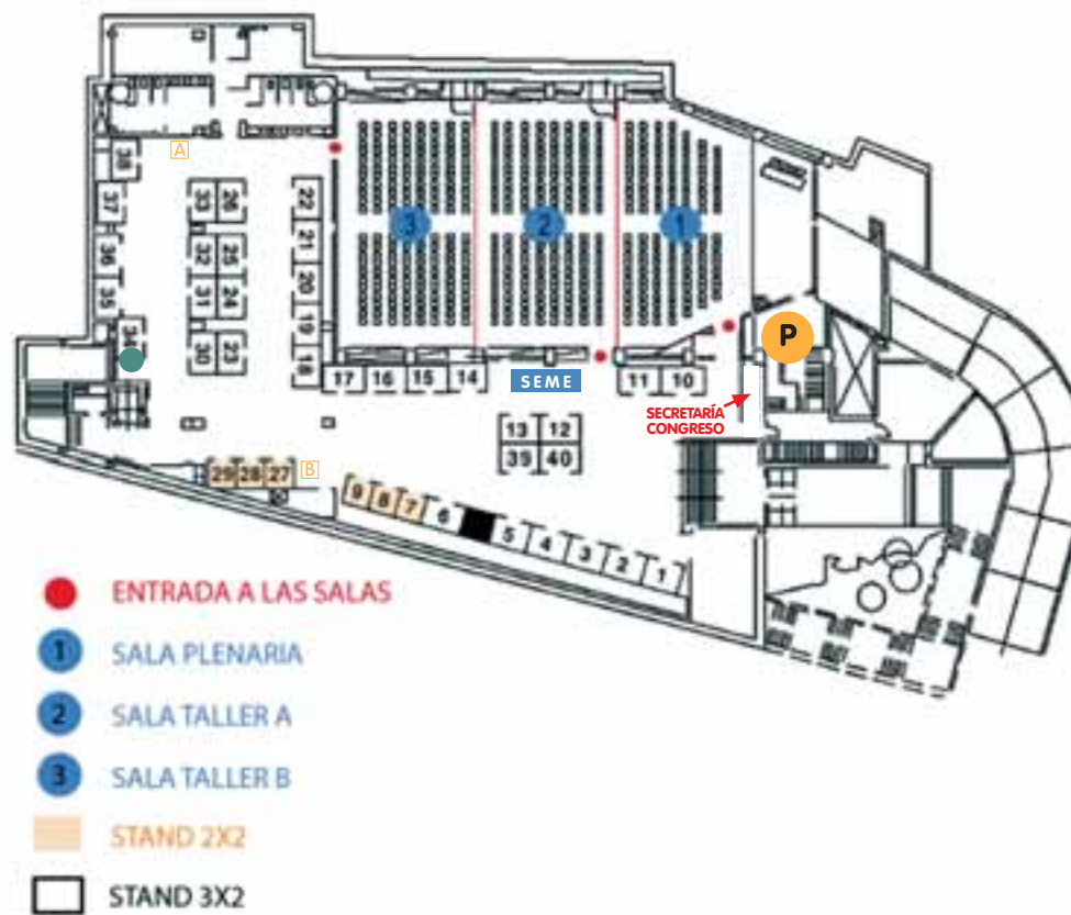
Planta -2 stands del 1 hasta el 40